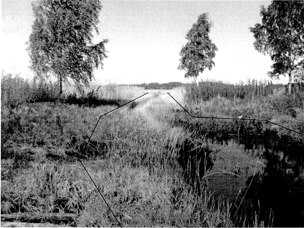
Foto 1. Kanal från pumpstation ut till Djupsundet, vy inifrån. Kanalen är väsentligt smalare än vid anläggandet och försvårar vattenflödet in till bevattningsanläggningen. Åtkomst med grävmaskin är främst tänkt att ske från södra sidan av kanalen (vänster sida i bilden). Grävmassor är tänkt att läggas upp på fast mark på södra sidan av kanalen. Björken på sydsidan av kanalen kan behöva tas ned i samband med grävarbetet. Linjerna visar approximativt ingrepp.