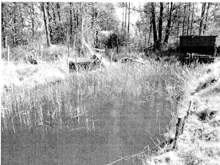
Foto 2. Området in till pumpstation. Dåligt tillflöde ger illaluktande och humusbemängt vatten.